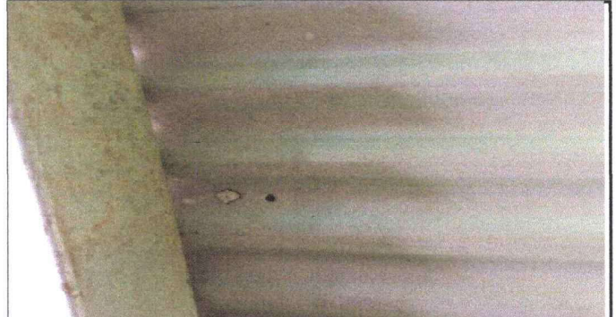
Foto 2: Cambio de techo de la escuela por perforaciones en la lámina metálica